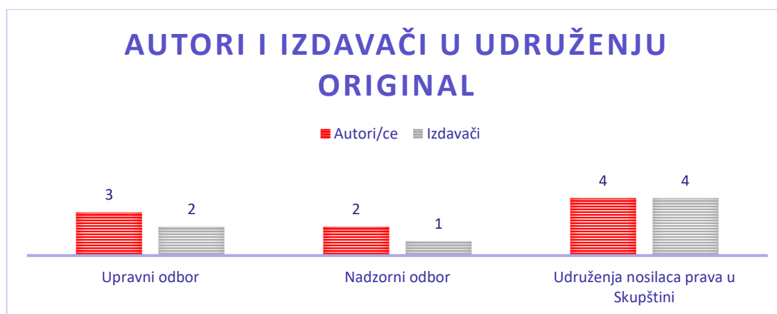
Grafika 2: Struktura učešća članova u radu organa Udruženja

Udruženje Original kolektivno ostvarivanje vrši na osnovu zakona, u skladu sa članom 5. i 9.st.1. Zakona o kolektivnom ostvarivanju autorskog i srodnih prava.